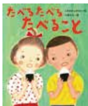
たべるとべるとべること