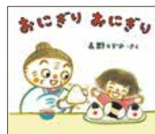
おにぎり おにぎり