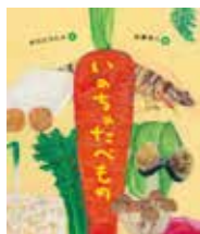
いのちのたべもの